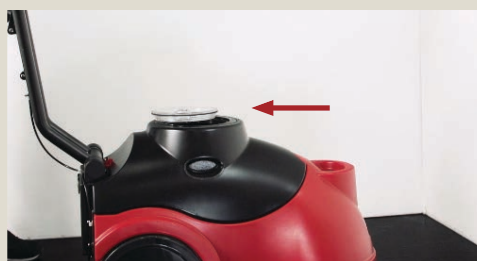
Оставить машину с открытой крышкой бака грязной воды.