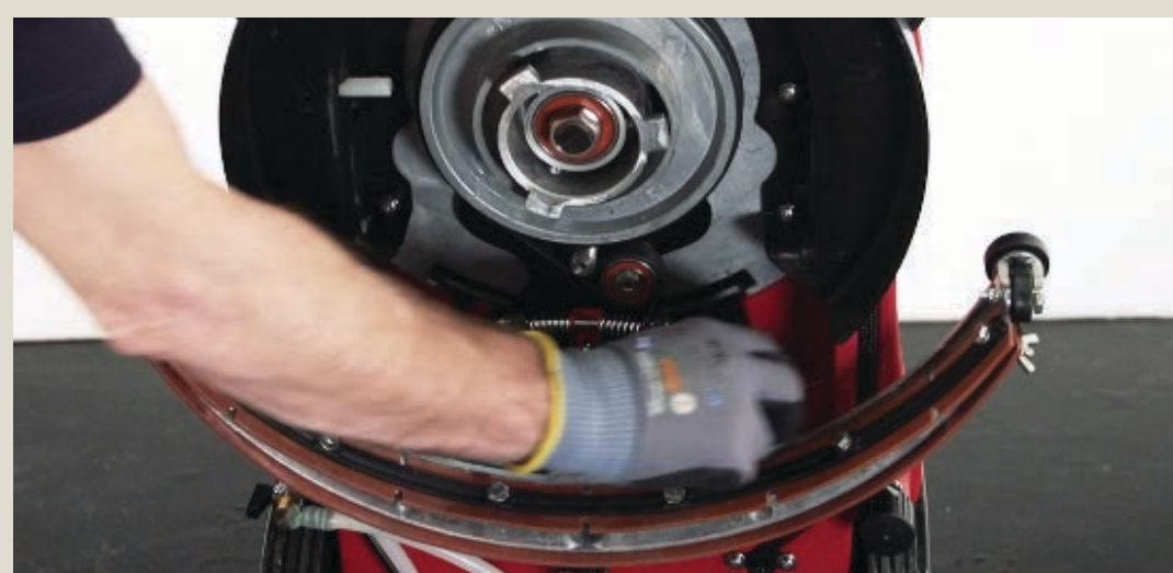
Снять скребок, проверить и очистить лезвия.