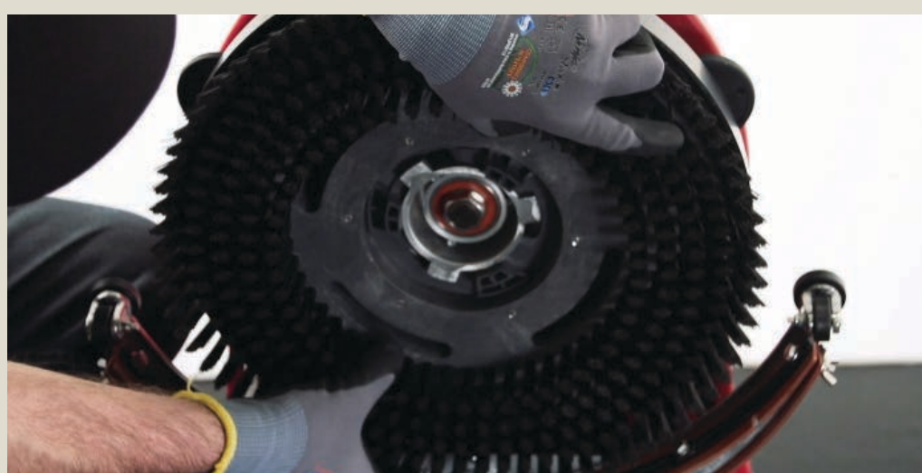
Осмотреть щётку или пэд.