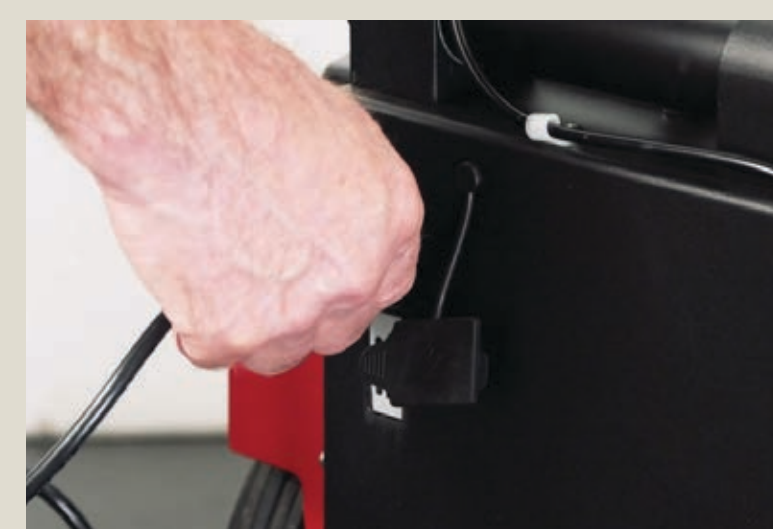
Подключить зарядное устройство к розетке.