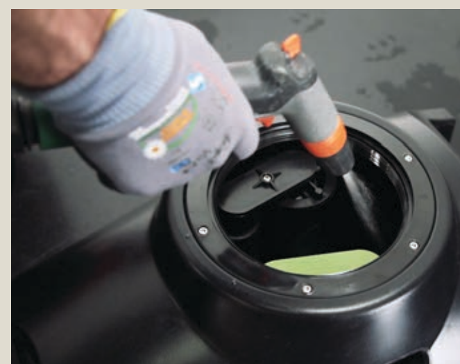
Очистить бак грязной воды.